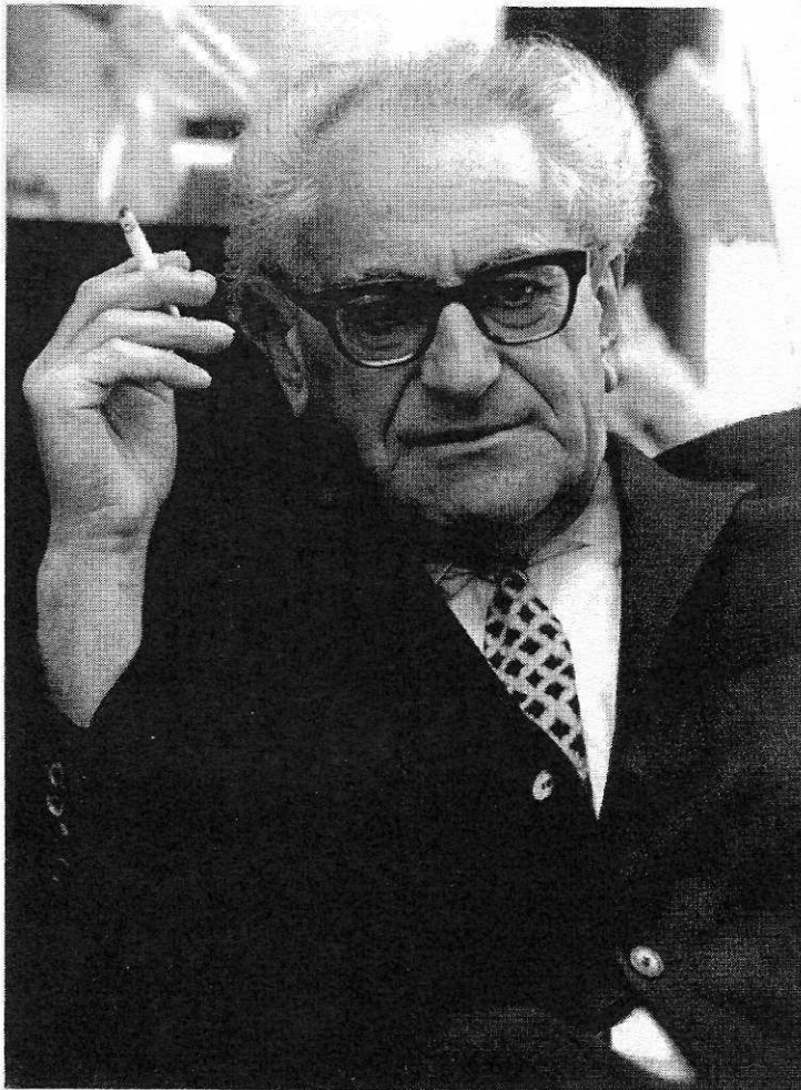
Fritz Bauer © Schindler-Foto-Report